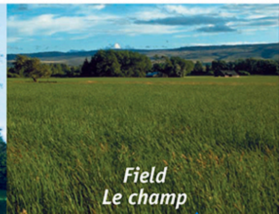
Field Le champ