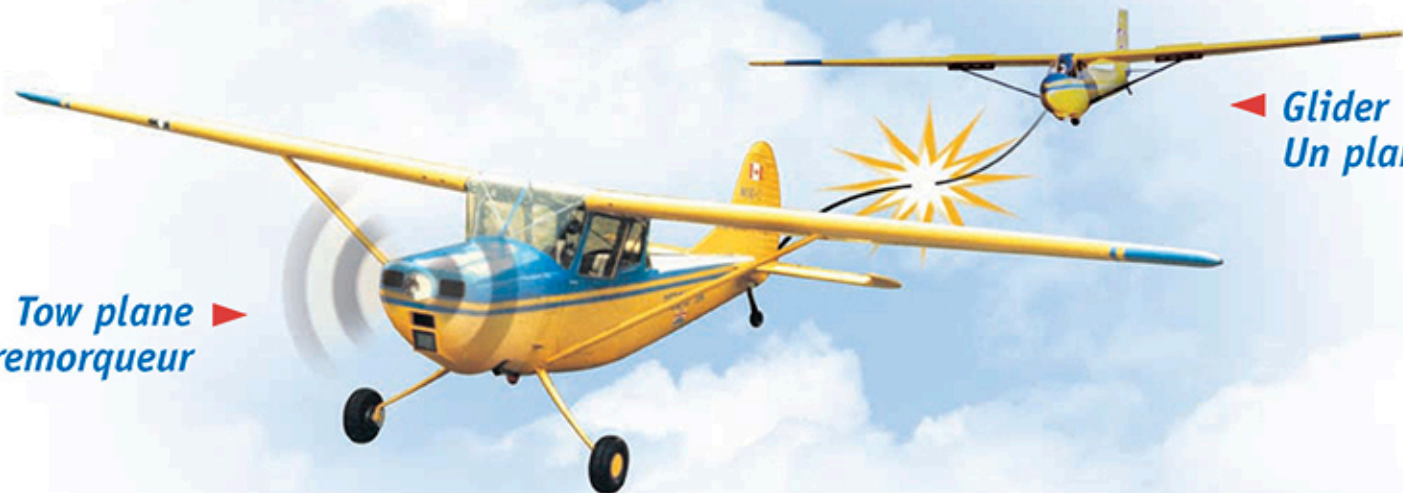
◀ Glider Un planeur