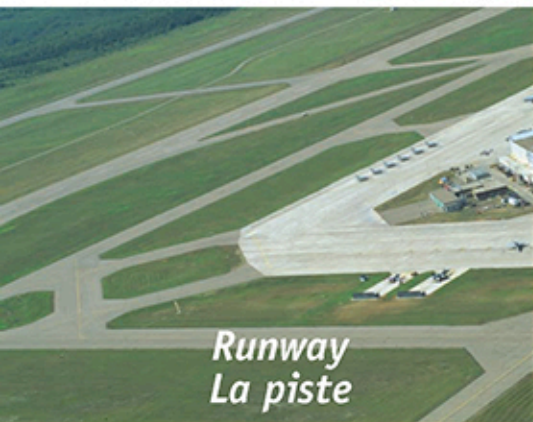
Runway La piste