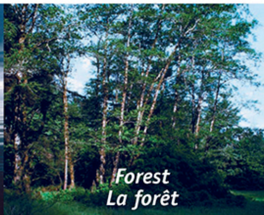
Forest La forêt